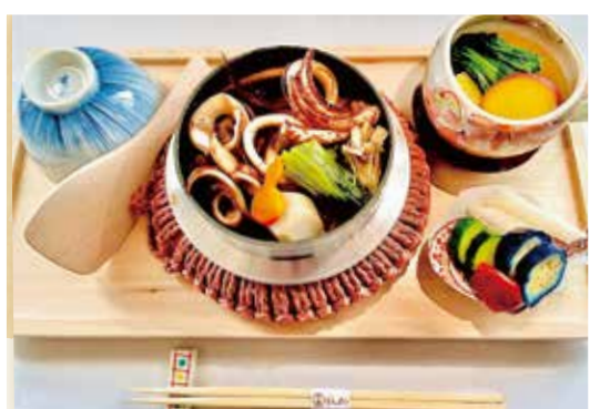
※写真はイカ釜めしです